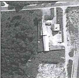
Žemės sklypo išdėstymo schema