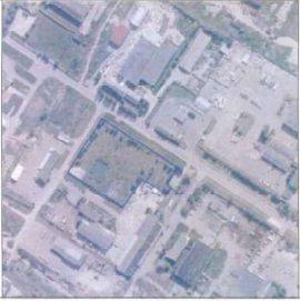
Zemės sklypo išrašymo schema