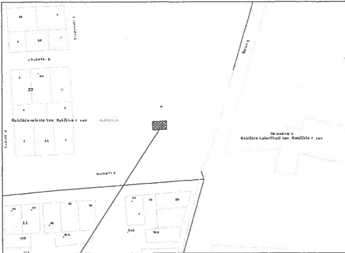
Sklypo išdėstymo schema