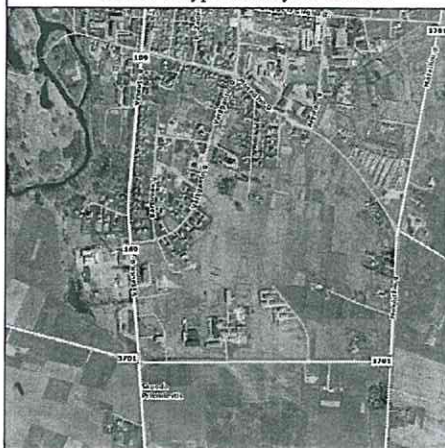
Žemės sklypo išdėstymo schema