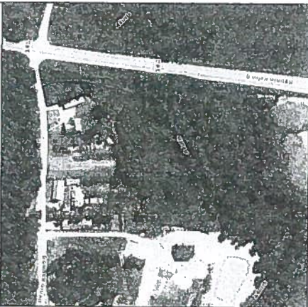
Žemės sklypo išstėtimo schema