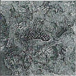
Žemės sklypo išdėstymo schema