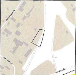
Žemės sklypo išdėstymo schema