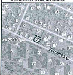
Žemės sklypo išdėstymo schema