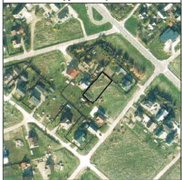
Žemės sklypo išdėstymo schema