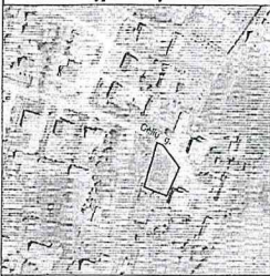
Žemės sklypo išdėstymo schema