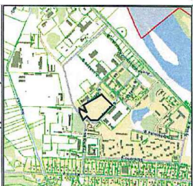
Žemės sklypo išdėstymo schema