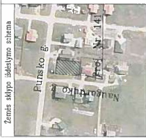
Žemės sklypo išdėstymo schema