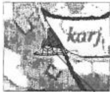
Sklypa iedziļināšanas shēma