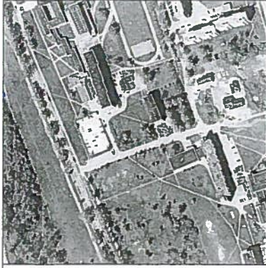
Žemės sklypo išdėstymo schema