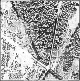
Žemės sklypo išdėstymo schema