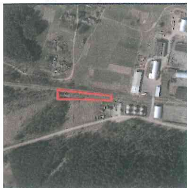
Sklypo išdėstymo schema